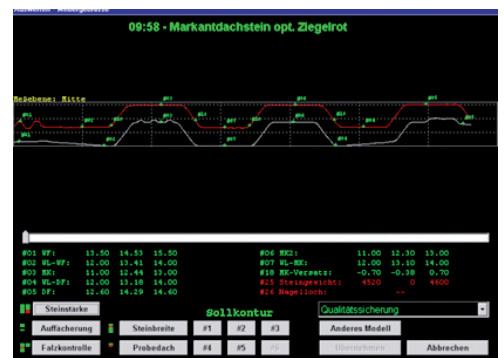
Auswertung der Messdaten