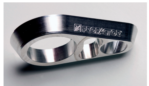
Bearbeitungsoptimierung an Serienteilen